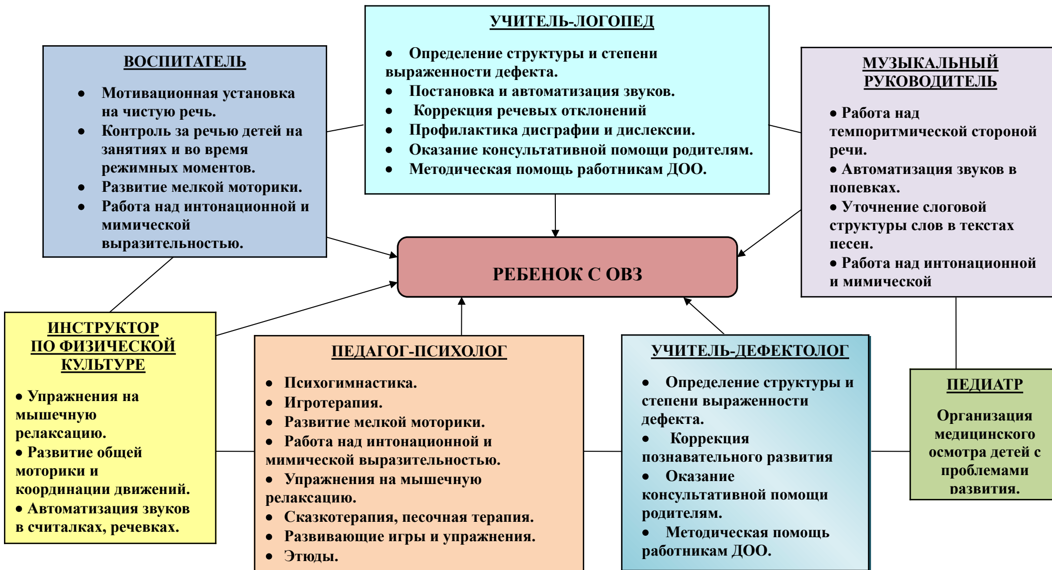
СХЕМА ВЗАИМОДЕЙСТВИЯ УЧАСТНИКОВ КОРРЕКЦИОННОГО ПРОЦЕССА СПДС «ИВОЛГА»