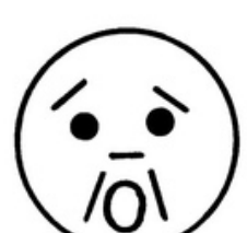
СТРАХ ( УЖАС )

Высокий уровень 3 балла. Ребёнок верно узнаёт и называет все предложенные эмоции самостоятельно