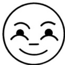
РАДОСТЬ ( ВЕСЕЛЬЕ )

Ребёнку предлагается рассмотреть карточки с графическим изображением. Предъявлять по одной с вопросом «Какая эмоция на лице?».