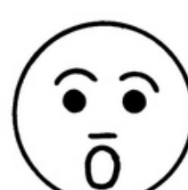
УДИВЛЕНИЕ ( ИЗУМЛЕНИЕ )