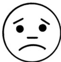
ГРУСТЬ ( ПЕЧАЛЬ )