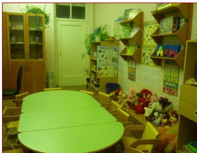
✚ Кабинет учителя-логопеда