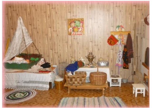
✚ Фольклорная студия «Сударушка»