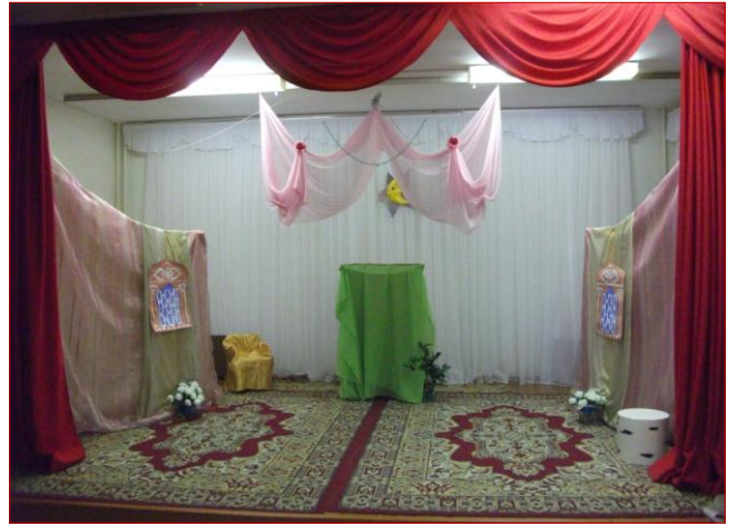
✚ Театральная студия «Сказка»