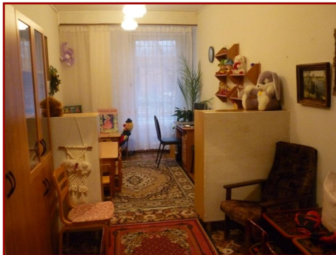
✚ Кабинет педагога-психолога