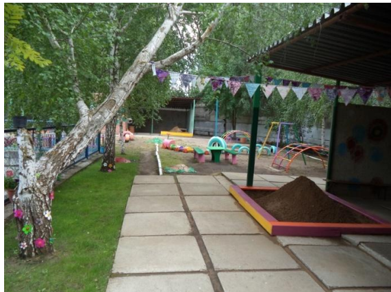
Игровые участки на улице